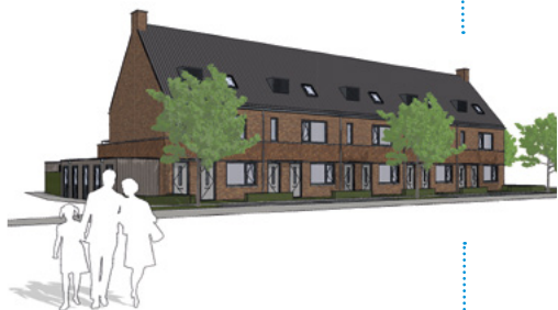
Voorbeeld woningen Kruksebaan