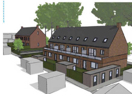
Voorbeeld woningen Patrijsweg

'De school heeft planten en struiken overgenomen die bij de sloopwoningen stonden'